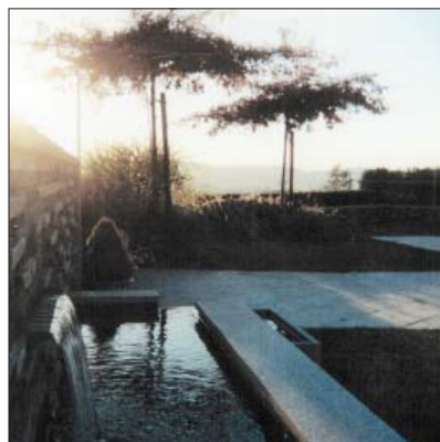
Gartenumgestaltung in Wermatswil ZH