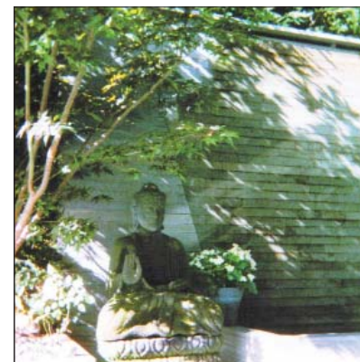
Terrassengestaltung in Erlenbach ZH