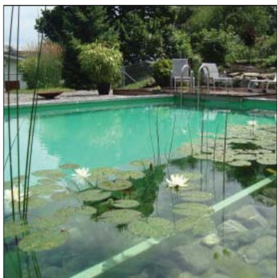
Gartenumgestaltung in Au SG