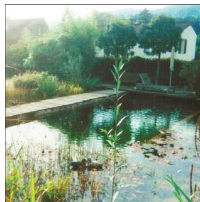
Gartengestaltung in Rheineck SG