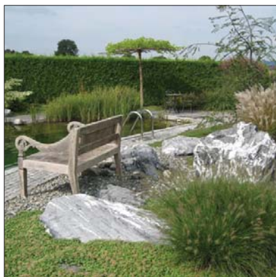
Gartengestaltung in Reichenburg SZ